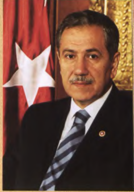
Bülent Arınç TBMM Başkanı