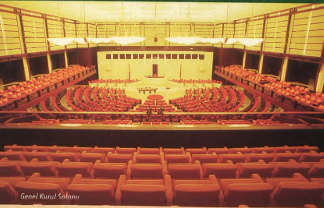
Genel Kurul Salonu