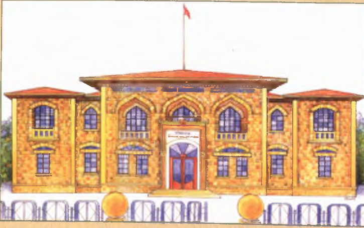
İkinci Meclis Binası

Bu ikisinden farklı bir şekilde doğrudan ve modern Meclis binası olarak tasarlanan bugünkü binanın yapımına 1939 yılında başlanmıştır. Projesi, Avusturyalı mimar Prof. Dr. Clemens Holzmeister'e aittir. Bina, 6 Ocak 1961 tarihinde hizmete açılmıştır. O tarihten bugüne, TBMM çalışmalarını bu binada sürdürmektedir. Tüm yerleşim alanıyla dünyanın en büyük ve en görkemli Meclis binalarından biri olan bu yapılar topluluğuna, dönemin gereklerine uygun olarak birtakım eklemeler de zamanla yapılmıştır.