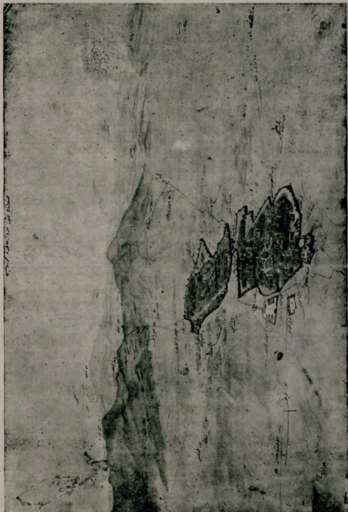
صنمايك ۵۰۰ متره ارتفاعدن كورونيشي