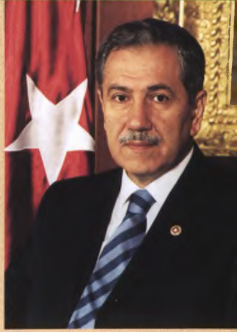
Bülent Arınç TBMM Başkanı