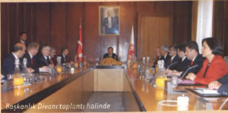
Başkanlık Divanı toplantı halinde

Meclis soruşturması, görevde bulunan veya görevinden ayrılmış olan başbakan ve bakanlar hakkında, görevleri sırasında kanunlara aykırı uygulama yaptıkları iddiasıyla soruşturma açılmasını ifade eder. İddiaya ilişkin önerenin Genel Kurul'da kabulü üzerine milletvekilleri arasından oluşturulan soruşturma komisyonu, rapor hazırlayarak, gereği için Genel Kurul'a sunar.