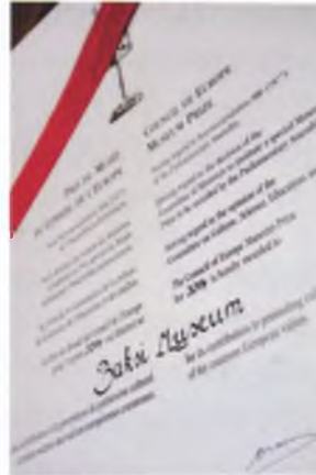
2014 Yılı Avrupa Konseyi Müze Ödülü Töreni