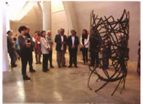
Miro'ya Açılan Heykelli Yol Sergisi