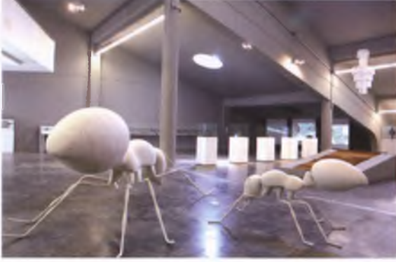
Mesafe ve Temas Sergisi