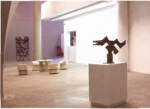
Miro'ya Açılan Heykelli Yol Sergisi