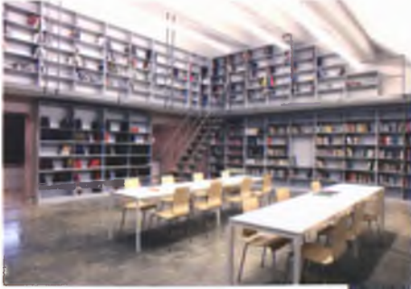
Baksı Müzesi Kütüphane