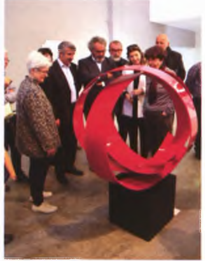
Miro'ya Açılan Heykelli Yol Sergisi